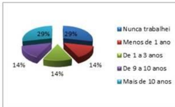
Gráfico 04: Tempo em que os docentes desenvolvem a Educação Ambiental